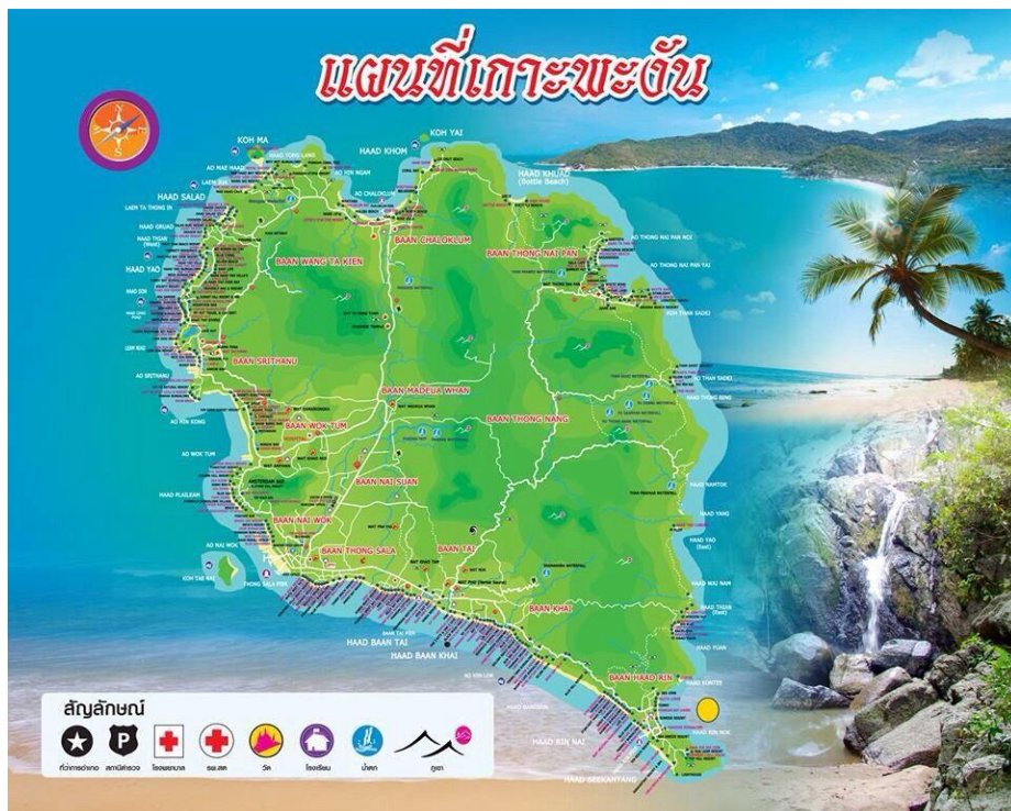
ภาพที่ ๑ แผนที่อำเภอเกาะพะงัน